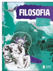
Filosofia 6º ao 9º ano