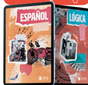
Español 6º ao 9º ano